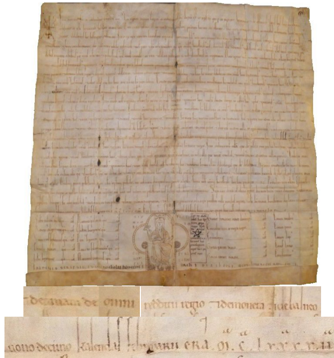
Entrega de Sancho III de la décima sobre moneda a Osma, en enero de 1154 (Archivo de la Catedral de El Burgo de Osma, vitrina, original)