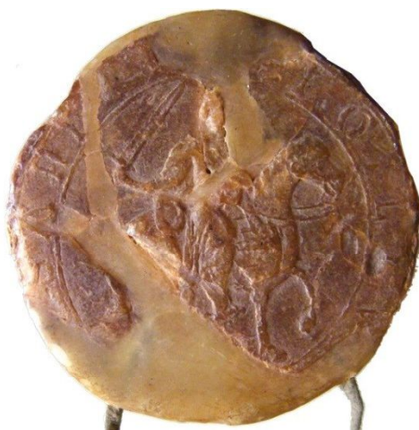
Fig.3: Sello céreo de Sancho III Archivo de la Catedral de Palencia, arm. 3, leg. 1, núm. 20 (Nuevo 272)

Por otro lado y ahondando en el estudio epigráfico de las leyendas, es necesario decir que en la primera de las emisiones se antepone el nombre del monarca a la titulación, invirtiéndose el orden en la segunda, a la par que se abrevia el nominativo del nombre del monarca con un apóstrofo que en la paleografía de la época tenía el valor de la terminación del nominativo en “VS”. En ambos tipos, el monarca decidió mostrar su retrato regio esquemático de perfil a derecha –siempre coronado y con poblada barba que debía ser característica definitoria de su personalidad– efigiándose, por tanto, como ya lo habían hecho su padre Alfonso VII, y sus predecesores: Urraca y Alfonso VI. Con ello, no se hacía sino confirmar la continuidad tipológica hereditaria de los primeros reyes cristianos peninsulares en la persona de este nuevo rey castellano. Sin embargo, no se trata éste de un acto peregrino, pues en realidad es la primera vez en la numismática medieval castellano-leonesa en que la imagen del busto regio se graba orientándola hacia la derecha, en un claro gesto que denota el ánimo de innovación monetaria que tenía Sancho III para el reino de Castilla: hasta ese mismo instante, toda representación monárquica medieval había sido reflejada e idealizada bien de frente o bien en escorzo lateral mirando a la izquierda 9 .