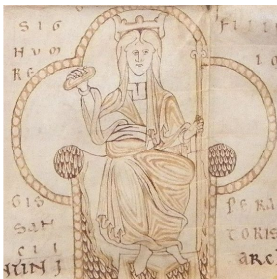
Signo Regio de Sancho III en un Privilegium conservado en el Archivo de la Catedral de Osma.

Ogronii ”, corroborando apenas un año después –el 27 de enero de 1151- el importante Tratado de Tudején con similar titulación. Alfonso VII le dio el espaldarazo definitivo cuando, aún en vida, le entregó la dignidad real nombrándole por su propia mano caballero en Valladolid, el 24 de marzo de 1152. A partir de ese instante Sancho III prácticamente ya no se separaría del Emperador, siguiéndole entre abril y septiembre de ese mismo año por Cuellar, Guadix, Lorca, Almería y, de regreso de esta última expedición militar, también en Toledo. La corona aún no era oficialmente suya, pues la seguía manteniendo su padre para sí, pero a los efectos, su jurisdicción sobre los territorios castellanos era ya en la práctica total y absoluta. Así, terminaría recibiendo los definitivamente a la muerte de don Alfonso en La Fresneda (Ciudad Real) el 21 de agosto de 1157. Pese a encontrarse Sancho temporalmente emplazado en Baeza en ese instante, volvió de inmediato a Toledo, para dar cristiana sepultura al cuerpo de su padre en la iglesia Mayor de la ciudad del Tajo, bajo la bendición de su arzobispo Juan, en cuya catedral le organizó sentidas, intensas y luctuosas exequias.