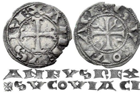
Fig.1: Dinero de Alfonso VIII acuñado en Segovia

En cuanto a las leyendas de las piezas, Sancho plasmó una abreviatura monetar -“ Sancius Rex/Tol Eta ”- similar a la que habitualmente utilizaba en su cancillería: “ Sancivs Rex Toletu et in tota Castella –Sancho Rey de Toledo y en toda Castilla” 5 -, cargando en apariencia la parte alusiva al toponímico de un significado anfibológico, tanto alusivo a la ciudad imperial como al propio reino y sus núcleos de población principales 6 . Ello encaja perfectamente con el hecho de ser él, como primogénito del rey que era, quien heredó el teóricamente más importante, o al menos el más amplio y con más capacidades expansivas, de los dos reinos en que Alfonso VII dividió sus territorios al morir, es decir, el reino de Castilla. Esta situación implicaba, por primera vez e indirectamente, una mayor preeminencia del trono castellano -con Toledo a su cabeza como cuna primigenia que fue del reino visigótico-, sobre el leonés -que fue cedido a la vez al segundogénito del rey Alfonso, Fernando II-, que pese a englobar a los originarios reinos de Asturias y de Galicia, pasaba de facto a un plano secundario en cuanto a relevancia territorial y política, aunque fuese en él donde en puridad residía aún el “ fecho de imperio ”.