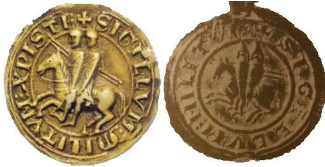
Sello céreo templario: "Sigillvm Militvm Xpiste"; y sello de Beltrand de Blancfort: "Sigillum Militvm".

Por último y como nota numismática final, debe comentarse que el rey Sancho no acuñó moneda de oro alguna, si bien sí que existe constancia de la circulación legal de moneda áurea musulmana en sus reinos – “et alios tantos morabetinos” , “regie parti mille morabetinos” o “libras purissimi auri” -. Respecto a la moneda de plata o de vellón, sin duda, siguió circulando la de su padre –e incluso la de Alfonso VI y Urraca- mezclada con la suya propia durante todo su reinado, realizándose los pagos a sueldos entre 1156 y 1158 – “solidos” - de doce dineros cada uno, amoldados al marco de plata – “regie potestati mille marchas argenti” -. Por idéntica razón sus propias monedas ( Véase S3:1 a S3:4 ) seguirían igualmente siendo válidas en Castilla durante los años posteriores a su muerte 31 , acaecida el 31 de agosto de 1158 en Toledo –en la capilla mayor de cuya catedral reposan actualmente sus restos-, circulando como numario válido al menos hasta la mayoría de edad de su hijo Alfonso, sucedida en 1166 32 .