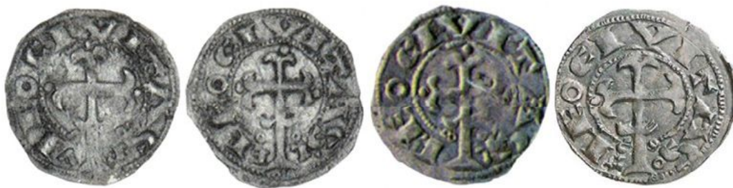
Fig.4: Marcas BV, LE, L y TO en dineros de Alfonso VII

Es decir, por asimilación, si las sílabas pareadas implicaban su atribución clara a una ciudad, en puridad, cabría pensar que también deberían significar lo mismo –si bien no es mandatario- que las letras sueltas o los símbolos labrados en sus monedas tuviesen una funcionalidad idéntica o muy similar.